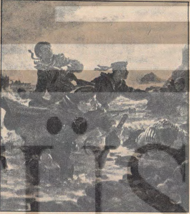
Kızıl Ordu askerleri faşistlere karşı çarpışıyorlar.

Burjuva hükümetler faşizmin iktidara gelişini kolaylaştıran gerici tedbirleri birbirine ardına alırken, faşistlerin saldırılarına gün geçtikçe yoğunlaşırken sosyal-demokrat önderler hala burjuvazinin devletinden medet umuyorlardı. Devletin, faşist