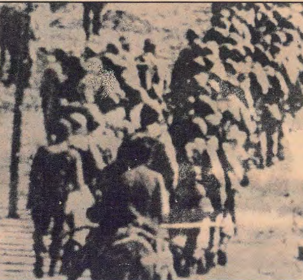
Hakkari'nin Beytüşşebap ilçesinde Kürt halkı üzerinde uygulanan militarist sindirme hareketi.

İstanbul DDKD: Biz genel olarak, Ulusların Kaderlerini Tayin Hakkı İlkesinden açık seçik ve kesin bir şekilde ezilen ulusların kendi devletlerini kurma hakkını anlıyoruz. Türkiye ile ilgili milli meseleden ise şunun anlıyoruz: Görüşümüze göre Kürt toplumunun konumu bir sömürge konumudur. Türkiye'de Kürt toplumu Türkiye'nin bir iç sömürgecidir. Bu yüzden Türkiye'de proletaryanın iktidara gelebilmesinin aşar şartı, Kürt ulusu üzerindeki sömürgeci siyasete son verilmesidir. Fakat, Kürt ulusunun sömürgeci boyunduruğundan kurtulması için proletaryaya iktidarı şart değildir.