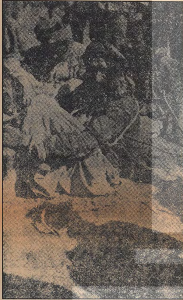
DERİM 1938. Bugün ülkemizde Kürt olmak demek doğrudan itibaren milliyetçi, söven ve militarist zulmün hedefi olmak demektir.

Ankara ve İstanbul DDKD yöneticileriyle yapılan röportajı yayımlıyoruz: