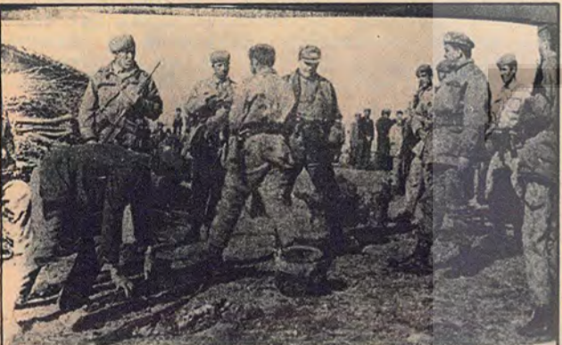
Doğu'da komandolar halktan silahlarını topluyorlar.

İstanbul DDKD: Faşizm özüde her yerde aynıdır. Fakat her ülkede uygulanış biçimleri o ülkenin somut şartlarına göre değişiklik göstermektedir. Bizim kanaatimizde ülkemizde sürekli faşizm vardır. Ülkemizdeki faşizmin i ki ayağı vardır. Bu ayaklardan biri emekçi