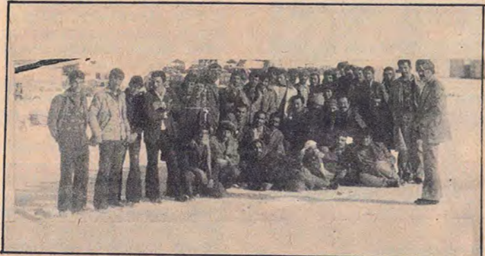
24 Kasım'dan bu yana direnen Boru-Hattı işçileri.

- Ne zamandan beri direniyorsunuz? - 24 Kasım'dan bu yana.