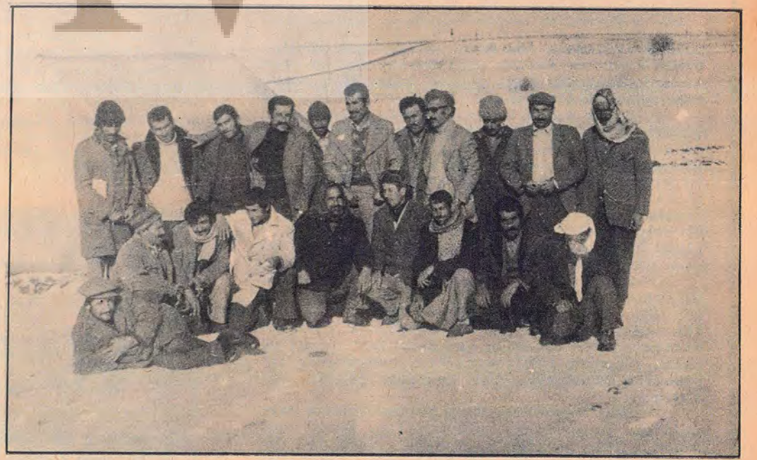
"Faşist grev kırıcıları bizi yıldırılmayacaktır."

Bilmen kaç senelik işçi olan dozer operatörü arkadaş sözü aldı. - Kaçak işçi çalıştırıyorlar. Bir arkada-