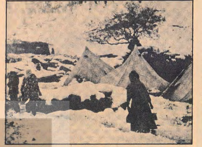
Lice'de halk yoksulluk ve karakış altında kaldı.

ynet bir biçimde ele alınmamalıdır. Türkiye'nin somut gerçeklerine göre yorumlanmalıdır. Her iki halk arasında gerçek anlamda bir kardeşliğin sağlanabilmesi için, hakim sınıflar tarafından yaratılan farklılığın giderilmesi gerekir.